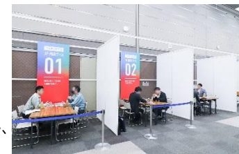
「OSAKAビジネスフェア2024 (前回)」の様子

( https://www.cgc-osaka.jp/event/businessfair_2024/ )